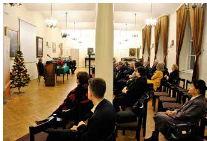
Spotkanie opłatkowe.