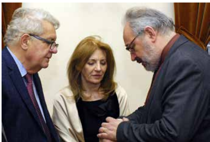
Uczestnicy konferencji „Pokolenia przechodzą (...) Przechodzą i Epoki (...)”