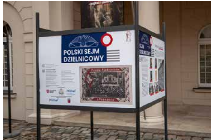
Otwarcie wystawy na temat Polskiego Sejmu Dzielnicowego przed Odwachem na Starym Rynku.