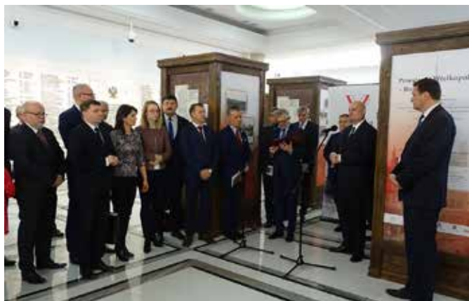
Otwarcie wystawy w Sejmie RP.