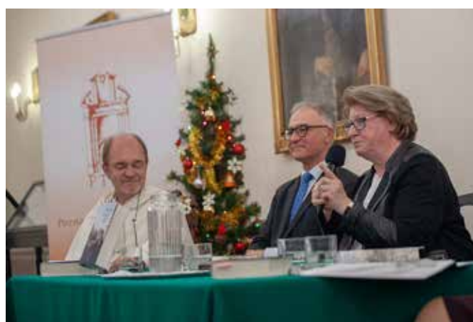
Spotkanie z prof. Hanną Suchocką.