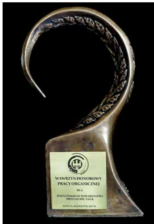
Statuetka Wawrzynu Honorowego Pracy Organicznej